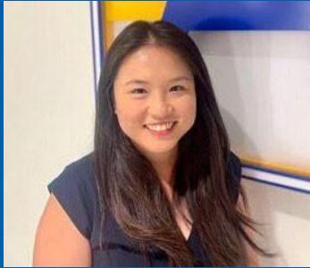
Directora: Catherine Han