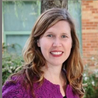
Directora: Maureen Nesselrode