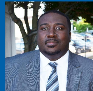
ዊልያምስበርግ ብርያን ቦይኪን