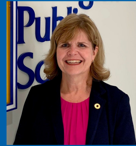
ስዋንሰን ብሪጃት ሎፍት