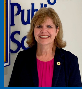
مدرسة سوانسن بريجيت لوفت