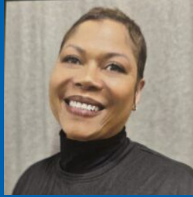
مدرسة غنستن كارولان جاكسن