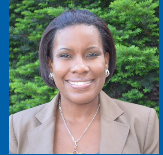
مدرسة توماس جيفرسون كيشا بوغان