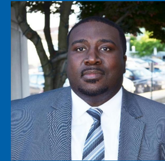
مدرسة وليامسبرغ براين بويكن